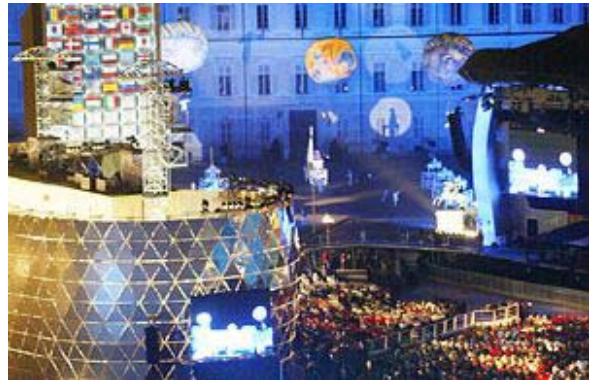
Cérémonie de clôture

Pour tout savoir sur les Paralympiques, allez voir le «AQSR en bref spécial Turin» sur notre site