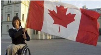
Un bel honneur pour Chantal Petitclerc.

Mardi 14 mars 2006 - Melbourne, Australie (PC) - Chantal Petitclerc a été désignée porte-drapeau de l'équipe canadienne pour les Jeux du Commonwealth de Melbourne, dont le coup d'envoi sera donné mercredi.