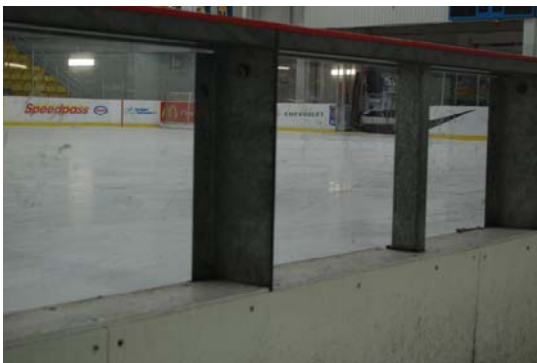
Les photos ici nous présentent une belle initiative pour le hockey sur glace. Cette arena est au Cari Complex à l'université de l'île du Prince Édouard