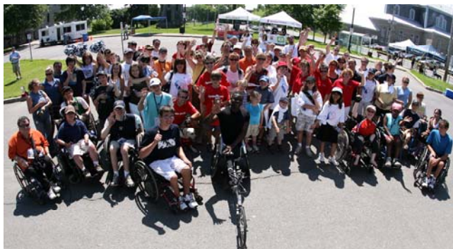
L'Association québécoise des sports en fauteuil roulant, ses athlètes, ses bénévoles et ses partenaires