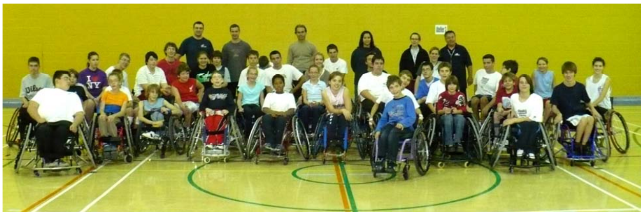
Les joueurs et les entraîneurs lors du 3e camp provincial de mini-basketball, à St-Hyacinthe