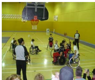
Les joueurs en pleine action!

Le dimanche, tous les joueurs retrouvaient leur équipe pour participer au premier tournoi de la Ligue provinciale de mini-