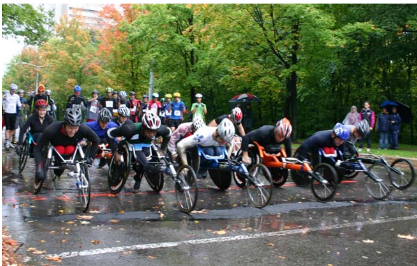
Départ aux 10km de l'Université Laval, 15 septembre 2007

En terminant, l'équipe de la Série 2007 d'athlétisme en fauteuil roulant tient à féliciter les athlètes pour leurs performances tout au long de l'été. Elle souhaite également remercier tous les artisans qui permettent à la Série d'exister et qui contribuent au rayonnement de l'athlétisme en fauteuil roulant au Québec.