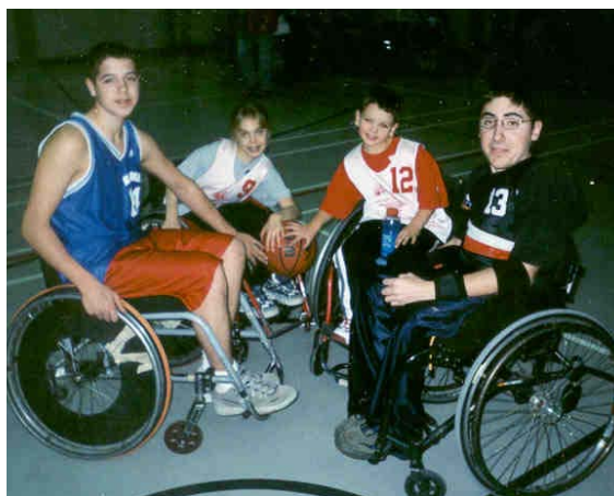
Sur cette photo un jeune de chacune des équipes présentes. CIVA les «mini tornade 1 et 2» de Montréal, les «mini-bulldog» de Québec et les «Minikami de St-Hyacinthe»

À tous les entraîneurs, gérants, parents accompagnateurs et arbitres aux noms des jeunes et de la communauté sportive de l'AQSFR Merci et félicitations !